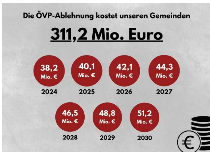
Die Grafik zeigt, wie viel Geld die burgenländischen Gemeinden wegen der Blockade der ÖVP Burgenland verlieren.