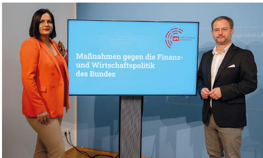
SPÖ-KO Fürst und LH-Stv. in Eisenkopf: Burgenland springt bei Gemeindefinanz für Bund ein — Maßnahmen gegen die katastrophale Finanz- und Wirtschaftspolitik der ÖVP/Grünen Bundesregierung