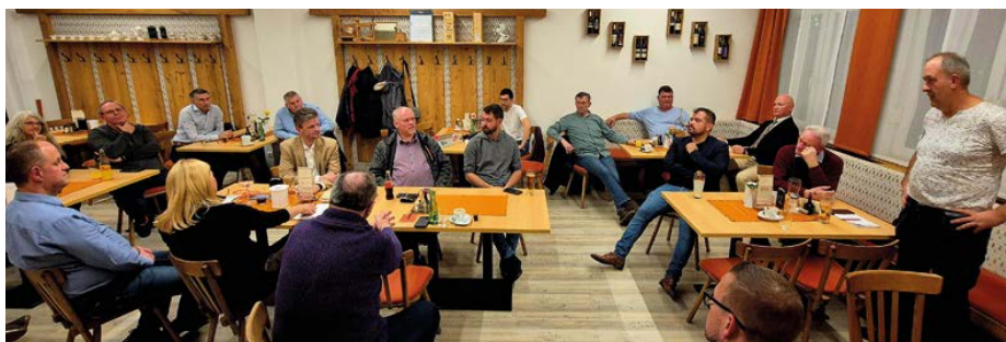
Beim Kommunalstammtisch des Bezirkes ND waren unter anderem das Wasserstoffwerk Zurndorf, die Hauptversammlungen im Wasserleitungsverband Nord und im Müllverband Thema.