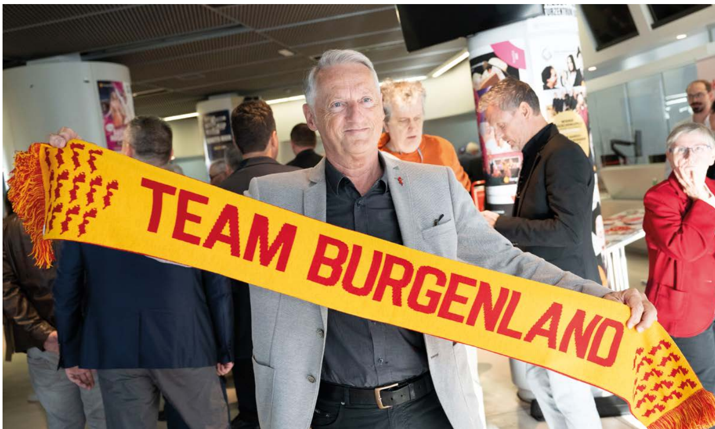
Großartige Stimmung im Vorfeld des Landesparteitages im Kultur und Kongresszentrum Eisenstadt