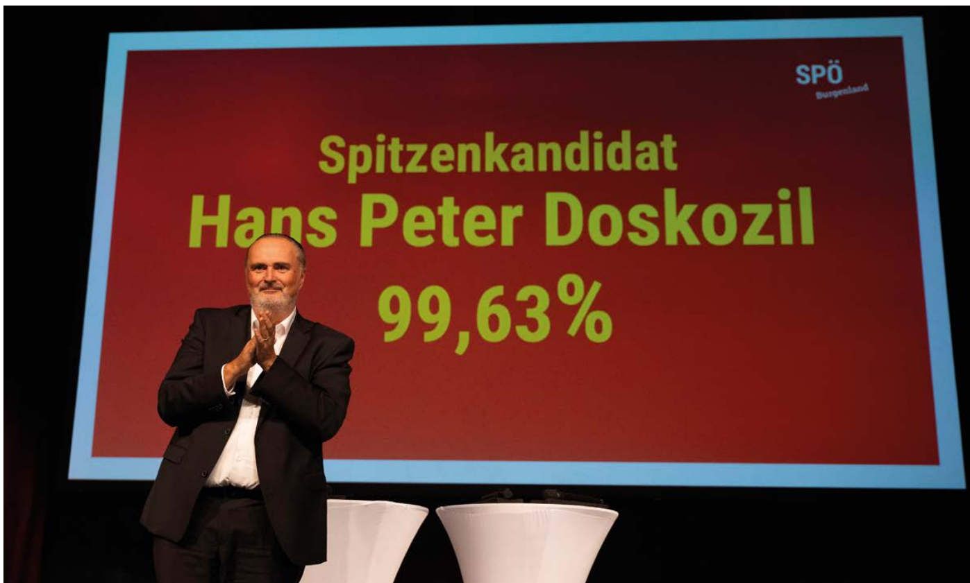
Landeshauptmann Hans Peter Doskozil bedankte sich bei den Delegierten für den großen Vertrauensbeweis und präsentierte seine Ideen zur Fortsetzung des erfolgreichen burgenländischen Weges.

greifen, um unsere Kommunen zu stabilisieren. Das bedeutet, wenn es notwendig ist, werden wir in Zukunft von Gemeinden, die sich in finanzieller Schieflage befinden, Kredite durch einen Fonds übernommen.“ Im Gegenzug werde es eine strengere Aufsicht bei der betroffenen Kommune samt verpflichtendem Konsolidierungspfad. „Den Weg, den wir in der Teuerung eingeschlagen haben, den Weg, den wir mit dem Mindestlohn eingeschlagen haben, den Weg, den